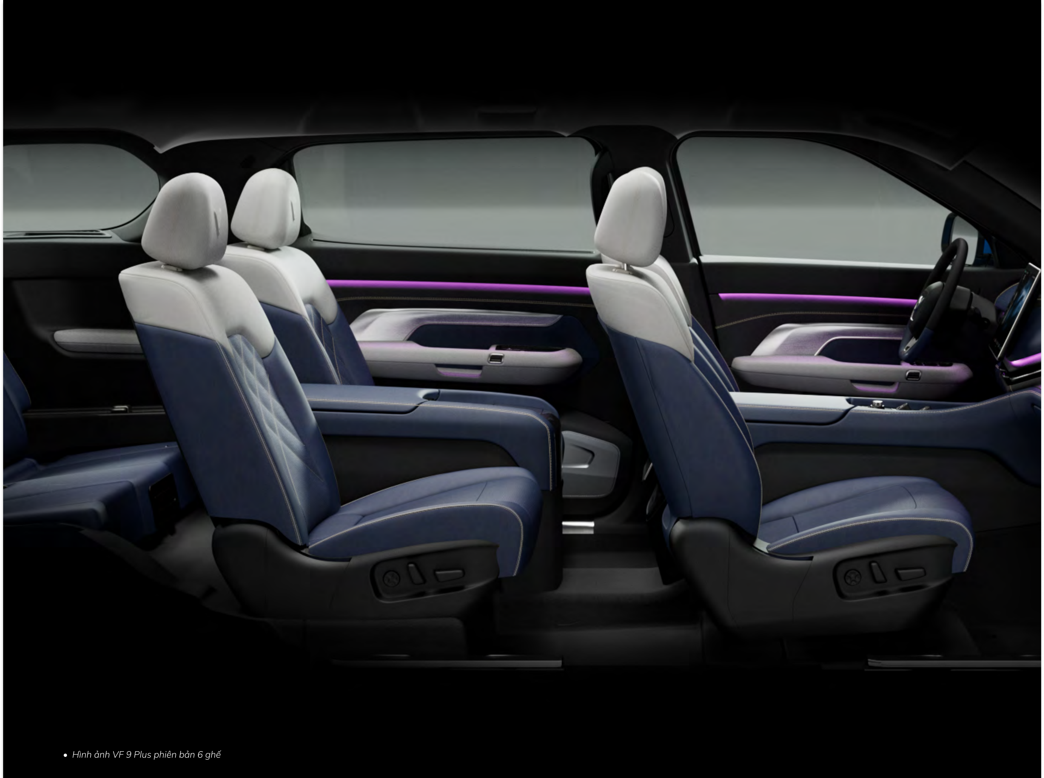
• Hình ảnh VF 9 Plus phiên bản 6 ghế